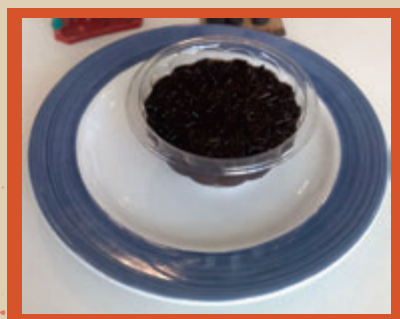
TORTA DE BRIGADEIRO 12,90