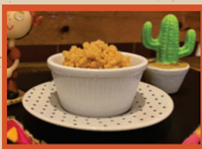
DOCE DE LEITE DO SERTÃO 10,90