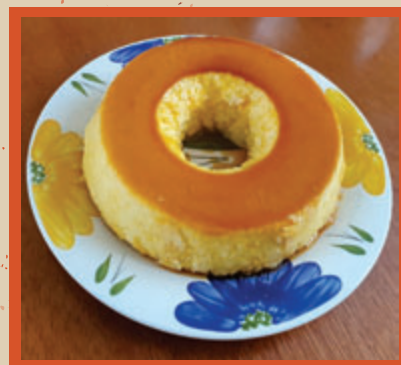
PUDIM DE TAPIOCA 12,90