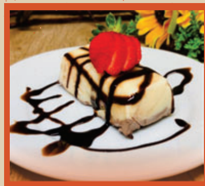
PAVÊ DE BROWNIE 13,90