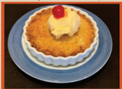
COGADA ASA BRANCA (DELICIOSA COCADA DE FORNO COM SORVETÉ DE CREME) 19,90