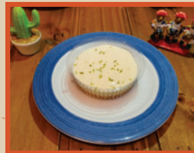
TORTA DE LIMÃO 12,90