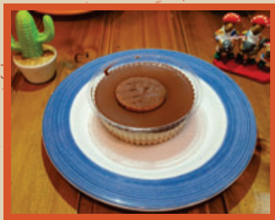
TORTA HOLANDESA 12,90